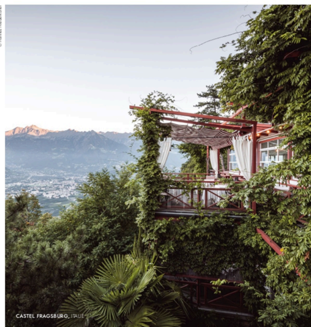
CASTEL FRAGSBERG, ITALIE

Ces engagements marquent une volonté profonde : celle de contribuer – à travers la table et l'hospitalité et grâce à notre passion commune pour le beau et le bon – à la construction d'un monde plus respectueux, plus solidaire, plus durable, en harmonie avec le vivant.