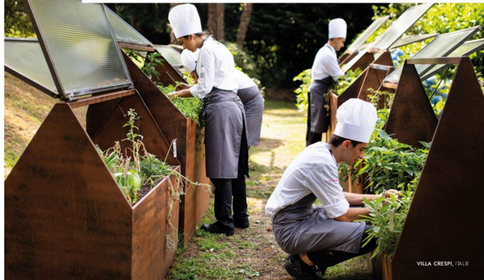
VILLA CRESPI, ITALIE